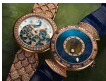
Les très belles Diva Peacock .

Les nouvelles montres Bulgari reflètent à nouveau l'esprit créatif et tout le savoir-faire de la Maison. Pour les femmes, la nouvelle Serpenti Spiga , réalisée en or et diamants, est dotée d'un motif matelassé complexe qui habille le poignet avec sensualité. La Diva Peacock , d'un raffinement suprême, souligne les plus beaux métiers d'art associés à des mécanismes sophistiqués. Enfin, la Lucea poursuit sa quête de jeux de lumière grâce à un cadran tridimensionnel unique en nacre marquetée.