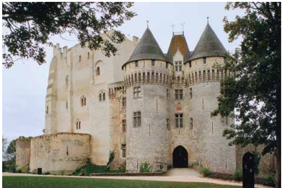
Le donjon rectangulaire du château (XI e ) de Nogent-le-Rotrou (Eure-et-Loir) est destiné à l'habitation.

Un pont permet de franchir le fossé ou les douves. C'est là qu'intervient la seconde défense car il s'agit généralement d'un pont-levis actionné par des chaînes ou des madriers. Levé, il double l'épaisseur de la porte du château fort