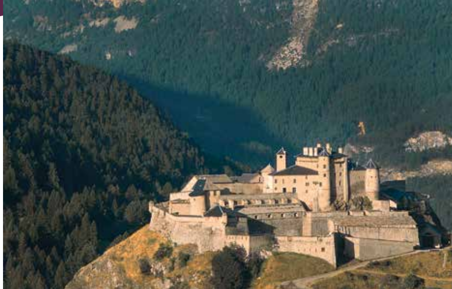
À Château-Ville-Vieille (Hautes-Alpes), le Château-Queyras (XIII e ) a été remanié par Vauban.

Notons que, pour d'autres besoins quotidiens, les châteaux forts étaient dotés de latrines – avec parfois une petite ouverture permettant d'aérer le lieu – dont le conduit d'évacuation débouchait sur le parement du donjon. Le plus souvent, elles étaient installées dans une bretèche en surplomb et servaient aussi de vide-ordures.