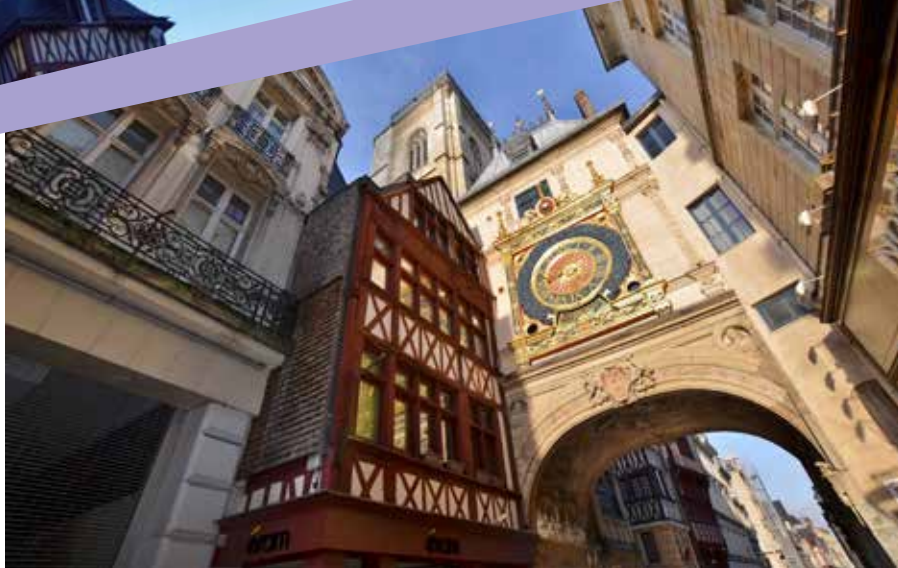
Incontournable : le Gros Horloge.

De nos jours, elle est le centre d'un tissu industriel puissant et d'une activité économique intense, avec, de surcroît, un port qui est le cinquième de France et le premier port européen pour l'exportation de céréales.