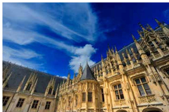
Les dentelles du Palais de Justice.