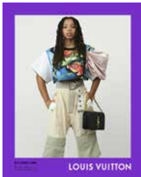
Chloé Bailey, chanteuse et actrice américaine.