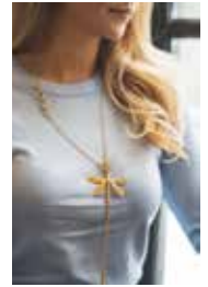
Belgian Creation