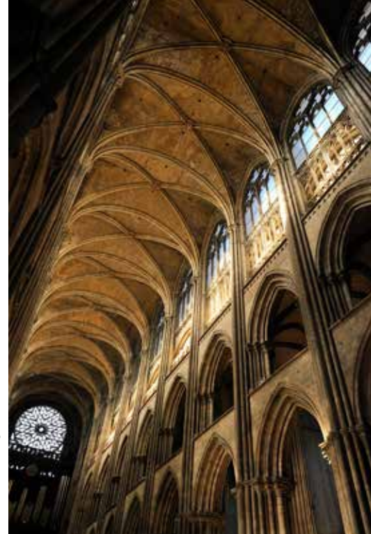
L'abbatiale Saint-Ouen : de majestueuses proportions.

Dans ce quartier, deux rues retiennent particulièrement l'attention : la rue Saint-Romain où l'on trouve quelques-unes des plus belles façades de la ville dont celle d'une maison de 1466, et la rue Saint-Nicolas, pavée, bordée de maisons à pans de bois.