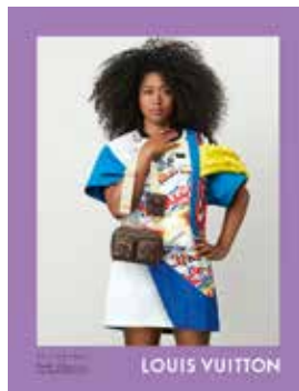
Naomi Osaka, joueuse de tennis japonaise.