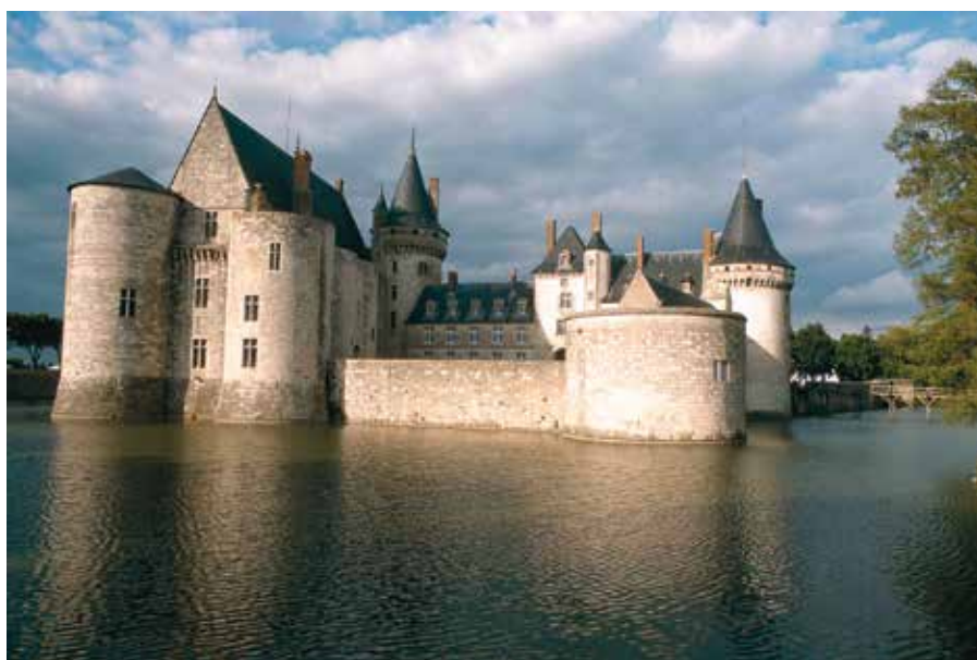
Le château de Sully-sur-Loire (XII e siècle), dans le Loiret, est protégé par des douves.

Comme on le constate, les châteaux forts étaient le fruit d'une multitude de réflexions et les architectes savaient trouver d'astucieuses solutions. Ils prévoyaient aussi des cuisines, une boulangerie et n'oubliaient pas la vie spirituelle en construisant des oratoires et des chapelles.