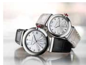
La lumineuse Lucea .