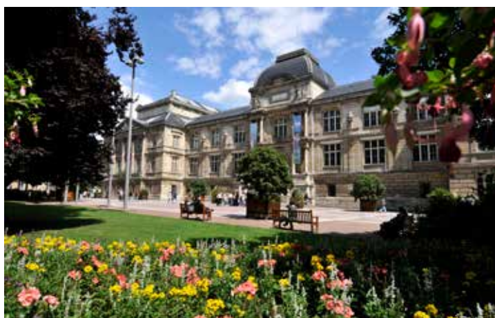
L'extraordinaire Musée des Beaux-Arts.

Non loin de la place du Vieux-Marché, dans la rue qui porte son nom, le Gros-Horloge est un ensemble architectural constitué d'un beffroi