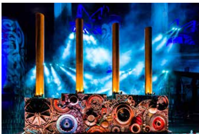
Une sculpture de... 27 tonnes.