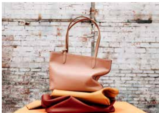
Louise , sac cabas

Pour sa collection Automne-Hiver 2021, Le Tanneur propose une plongée dans le design et l'architecture des années 30. Les déclinaisons couleurs s'inspirent de matériaux bruts et naturels : un marron profond acajou, un jaune clair qui s'inspire du rotin, un rose minéral quartz, un bleu pétrole et un gris béton pénétrant.