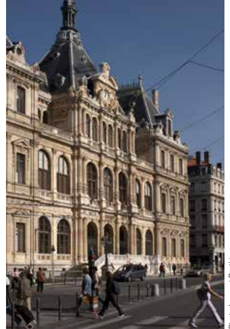
Le majestueux Palais du Commerce et de la Bourse.

de Cybèle et les restes d'un quartier artisanal.