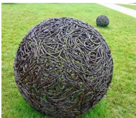
Un extraordinaire travail.