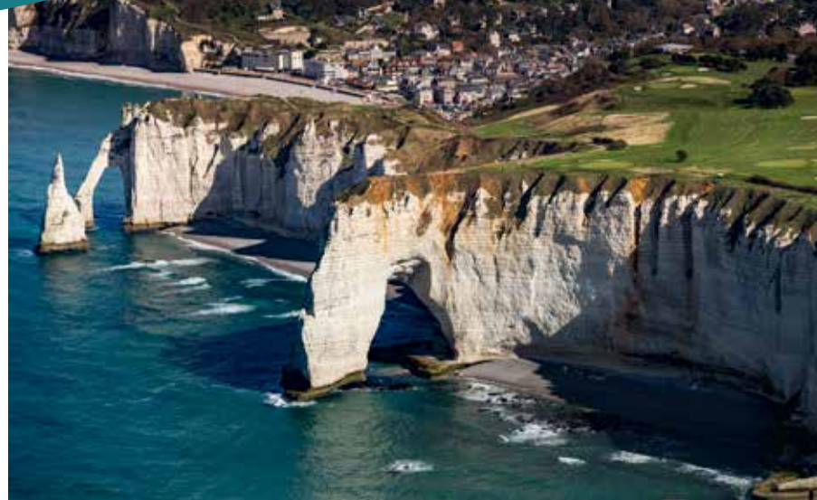
Les élégantes et imposantes falaises d'Étretat.