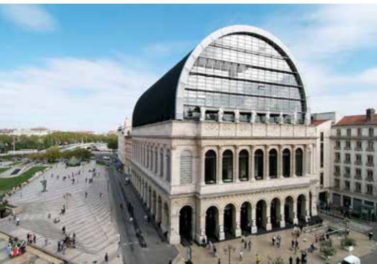
L'Opéra National de Lyon, remanié par Jean Nouvel.