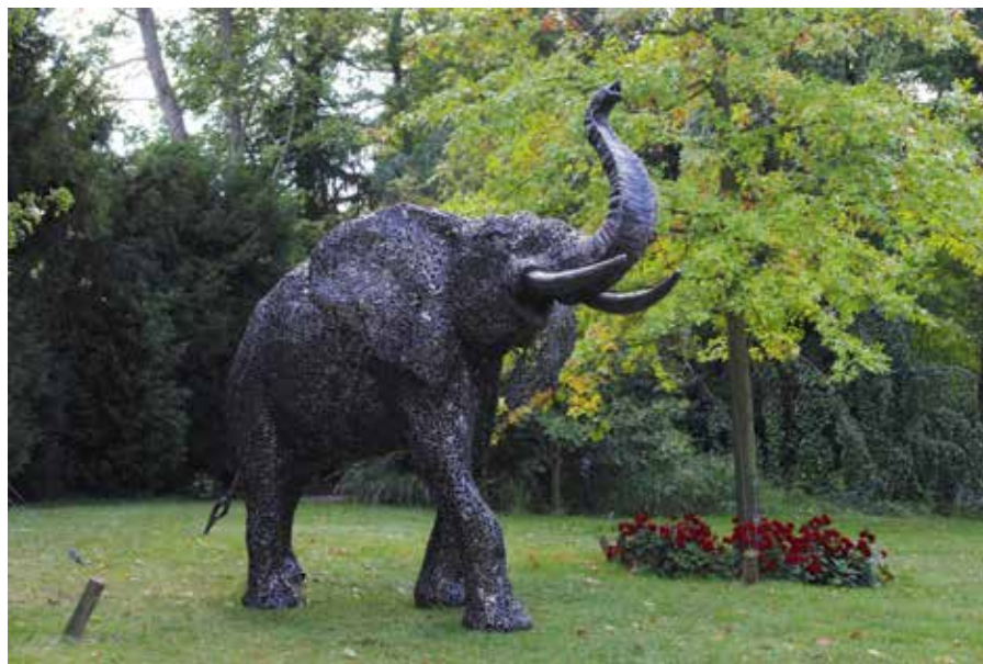
Un éléphant à l'échelle 1.