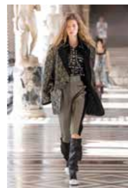
Photos-Louis Vuitton x Fornasetti