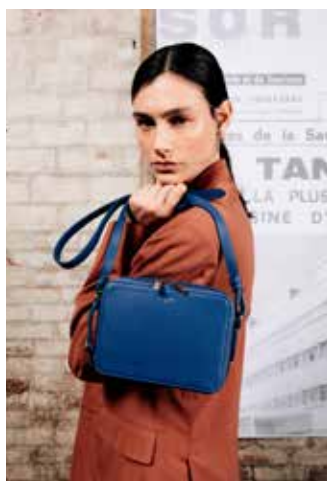
Gisèle , petit sac à main