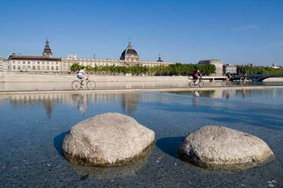
Immense et très élégant, le Grand Hôtel-Dieu.