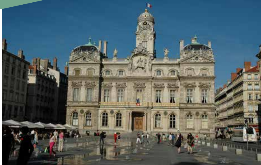
Face à l'Opéra National, l'hôtel de ville.

Lyon est depuis toujours riche d'un patrimoine de grande qualité. Les théâtres romains participèrent de la fondation de Lugdunum en 43 avant