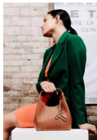
Juliette , petit sac à main