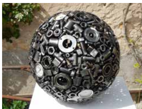
L'art de recycler des éléments métalliques.