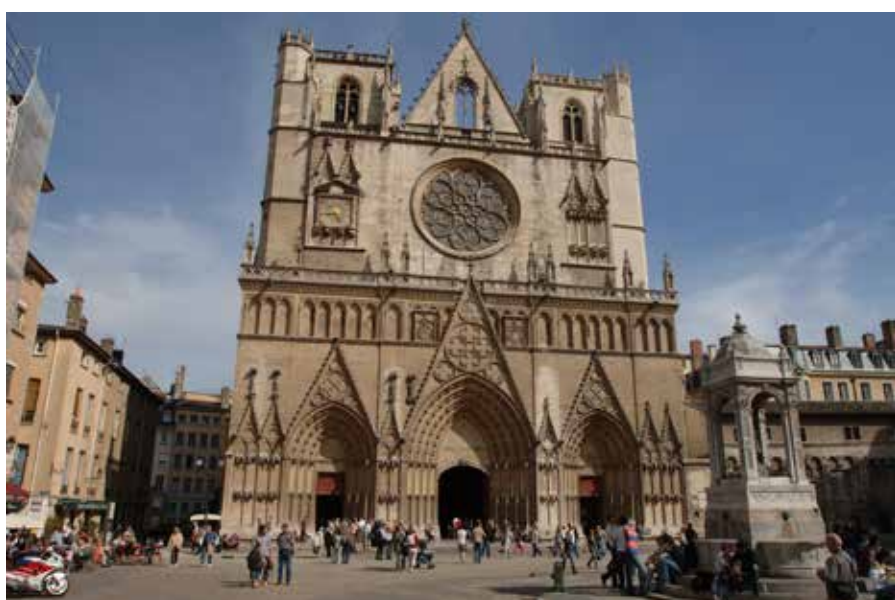
La primatiale cathédrale Saint-Jean-Baptiste et sa magnifique rose.