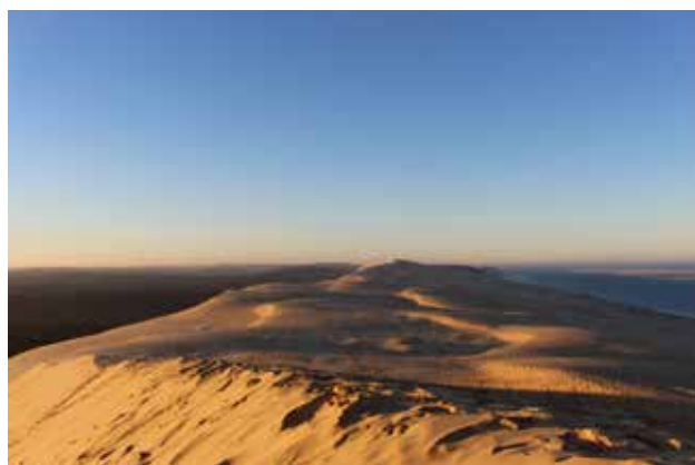
L'immensité de la dune du Pilat.

Dirigeons nos pas vers l'ouest pour aborder une autre terre de montagnes : le Massif central et son magnifique parc naturel régional des volcans d'Auvergne, et plus particulièrement les monts du Cantal. Ici se trouve le plus grand massif volcanique d'Europe dont le point culminant est le Plomb du Cantal qui, comme l'Etna, est un stratovolcan, c'est-à-dire un volcan au volcanisme explosif, d'où des versants très pentus. Il y a 5 millions d'années, la région connut une intense activité dont subsiste de