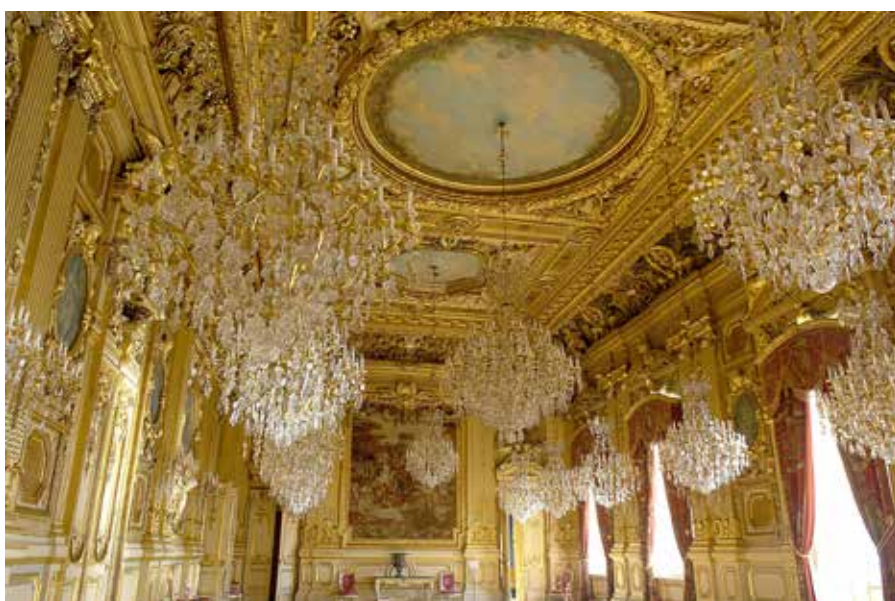
Le somptueux grand salon de l'hôtel de ville.