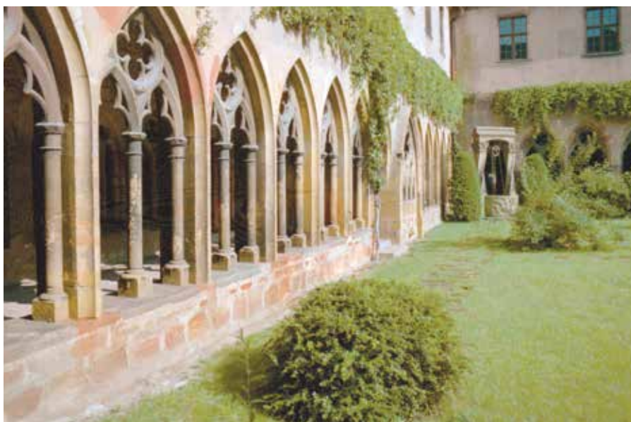
Le musée Unterlinden.

A Colmar trois quartiers se distinguent particulièrement : le quartier des Tanneurs, bâti aux XVII e et XVIII e siècles,