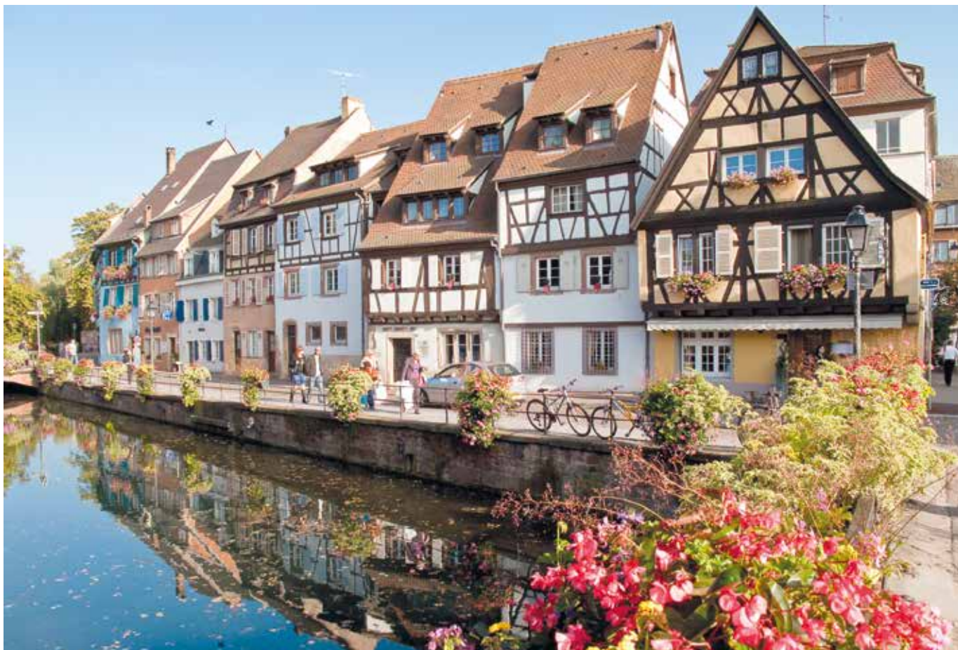
Le quai de la Poissonnerie.

ture gothique en Alsace. Surmontée d'un original lanternon à bulbe, elle a fait l'objet de plusieurs restaurations dont la dernière, menée en 1982, a permis de mettre au jour les fondations d'une église de l'an mille et des traces d'agrandissements successifs conduits aux XI e et XII e siècles. Cette collégiale a été le siège d'un évêché constitutionnel de 1791 à 1802.