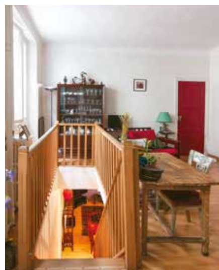
L'escalier peut être lui aussi un puits de lumière.

La lumière naturelle peut arriver aussi par le sol si l'on remplace une partie de celui du rez-de-chaussée par une dalle ou des pavés de verre. Mieux : s'il s'agit d'un ancien atelier (par exemple) éclairé par une verrière, celle-ci apportera une lumière zénithale abondante qui inondera la trémie et pourra atteindre, à travers cette dalle ou ces pavés, la cave ou le sous-sol.