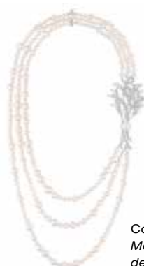
Collier Moisson de Perles.