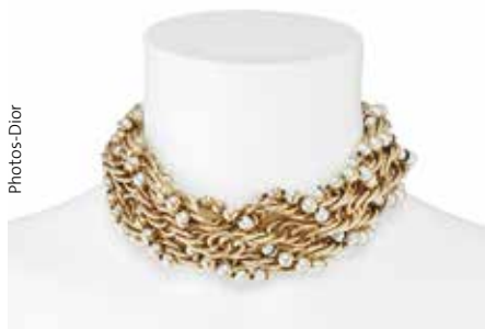
Collier Dior DNA en métal finition or et perles de résine crème.