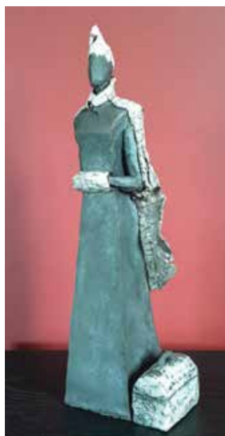
Voyage 4 (terre cuite émaillée).