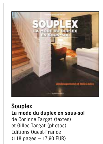
Souplex La mode du duplex en sous-sol de Corinne Targat (textes) et Gilles Targat (photos) Editions Ouest-France (118 pages – 17,90 EUR)