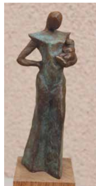
Petit ange (bronze).

premières productions sont figuratives et, pendant trois ans, il réalise des personnages et des animaux. Un travail très académique dans lequel il excelle et qui lui permet de bien maîtriser les différentes techniques.