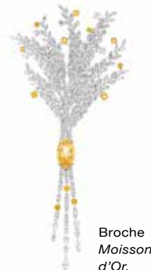
Broche Moisson d'Or.