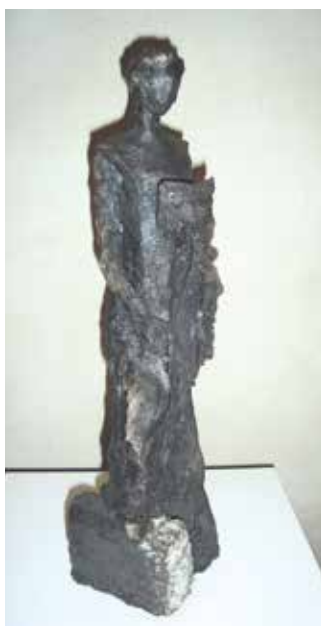
Voyage 10 (terre cuite émaillée).