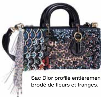
Sac Dior profilé entièrement brodé de fleurs et franges.