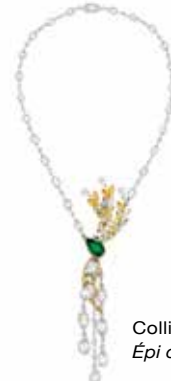
Collier Épi d'Été.

La collection de Haute Joaillerie Les Blés de Chanel célèbre pour la première fois cet élément fondamental de l'univers de Gabrielle Chanel. La collection suit le cycle de la vie du blé en 62 pièces de Haute Joaillerie.