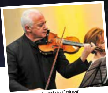
Festival International de Colmar (Vladimir Spivakov)