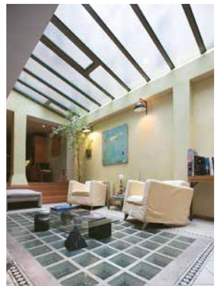
La lumière de la verrière pénètre au sous-sol à travers les pavés de verre du rez-de-chaussée.

Mais le rez-de-chaussée de certains immeubles est parfois occupé par d'anciens commerces (café, épicerie, droguerie, vêtements, chaussures...) ou boutiques d'artisans (cordonnerie, boucherie, reliure, boulangerie, serrurerie, plomberie...) : les centres-villes en présentent de plus en plus, les activités se déplaçant vers les centres commerciaux ou les zones commerciales périurbaines. Ces locaux sont dotés de réserves au charme moindre mais dont l'avantage est d'avoir été déjà utilisés, donc aménagés en fonction de leur utilité.