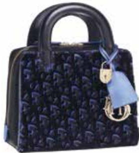
Sac Lily en toile Dior empreinte bleue, broderie velours tuftée noire.