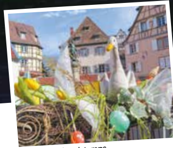
Colmar fête le printemps