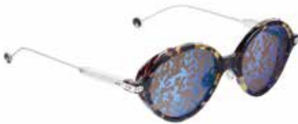
Lunettes de soleil Dior Umbrage . Forme arrondie en acétate écaille, branches sophistiquées en métal argent. Verres exclusifs miroir feuillage bleu.