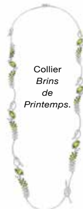
Collier Brins de Printemps.