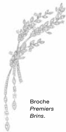
Broche Premiers Brins.