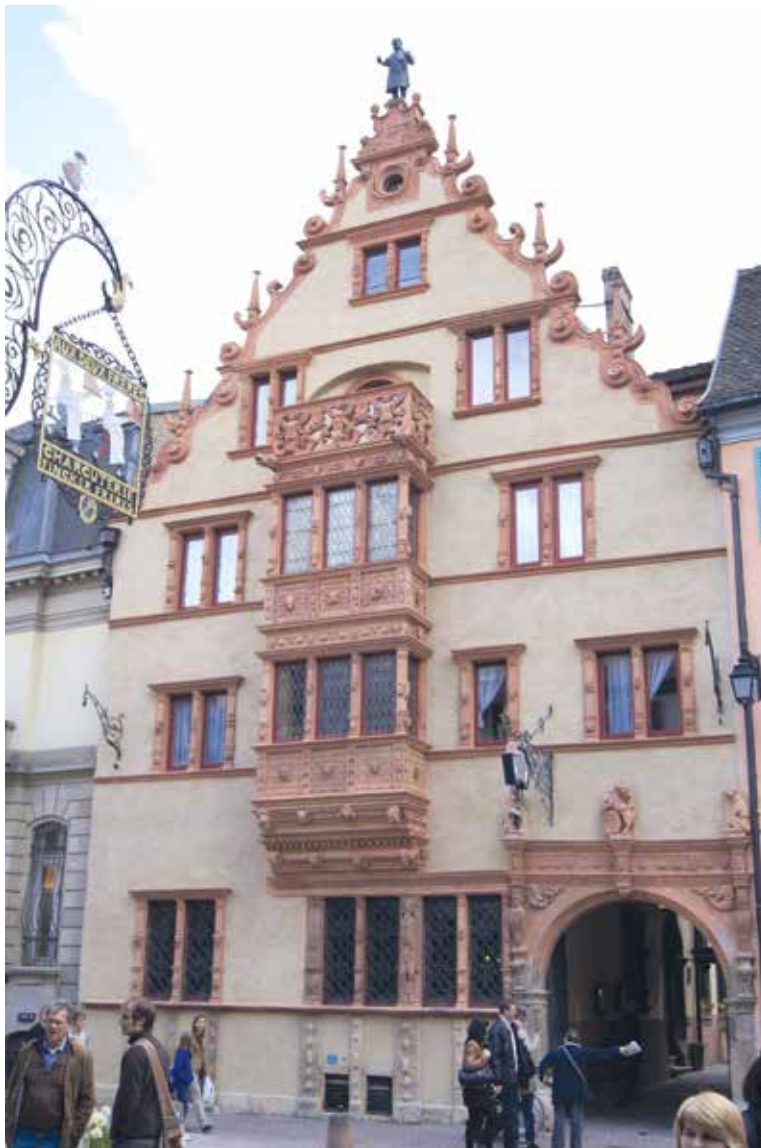
La Maison des Têtes.

Le Musée Hansi a la particularité de reproduire une superbe place de village alsacien qui permet de retrouver l'ambiance des scènes dessinées par Jean-Jacques Waltz, plus connu sous le pseudonyme de Hansi. Au premier étage, de multiples oeuvres originales et