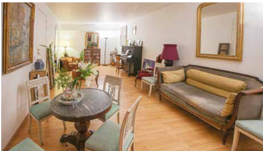
Cette grande pièce très cosy était une cave.

un sous-sol dans un immeuble exclusivement réservé à l'habitation est celui de l'accès : dans le cas d'une cave unique (mais de belle taille), il faut impérativement prévoir de créer une trémie pour le futur escalier.