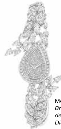
Montre Brins de Diamants.