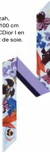
Mitzah, 6 x 100 cm ABCDior I en twill de soie.