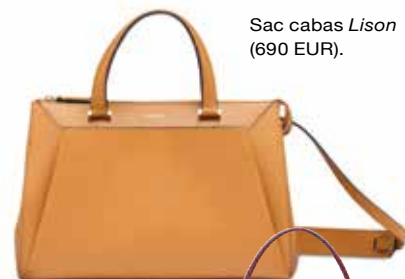
Sac cabas Lison (690 EUR).