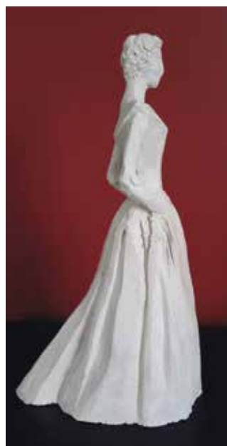
La mariée (terre cuite).